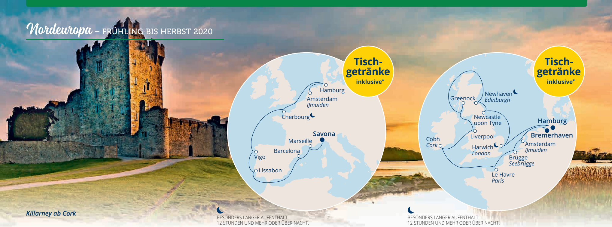
Killarney ab Cork