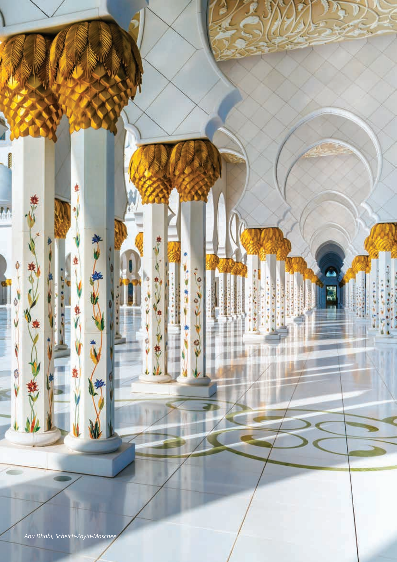
Abu Dhabi, Scheich-Zayid-Moschee